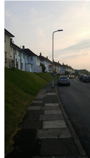
KOTIKATU, BARNE BARTON