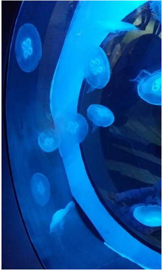
NATIONAL MARINE AQUARIUM