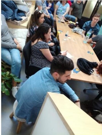
Markkinointiviestintäyrittäjäyrittäjä Machin Bidule'ssa

paikallisessa markkinointiviestintäyrittäjäyrittäjä Machin Bidule'ssa, missä ryhmät esittelivät ideansa kahdelle konsultille, jotka sparrasivat ryhmiä jatkotyöskentelyä varten. Asiantuntijoiden kommenttien vauhdittamina ryhmät tarkensivat yritysideoita ja valmistelivat presentaation pienimuotoista sosiaalisen yrittäjyyden yritysideoita kilpailua varten. Ansiokkaat tuotokset esiteltiin tapaamisen viimeisenä päivänä ja valittiin kolme parasta ideaa. Kolme palkittua sosiaalisen yrityksen ideaa olivat: KOOL – Key Of Online Learning, Language Barrier, SMAPP – we value your smart –needs.