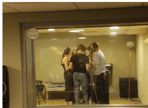
'La Baraka Prod.' studiolla äänityspuuhissa Suomen tiimi

Mukaan mahtui myös kulttuurikierros Le Mansin vanhassa kaupungissa, jossa Le Mansin pormestari järjesti kaupungintalolla juhlallisen vastaanoton koko ryhmälle. Päätösillallisen nautimme