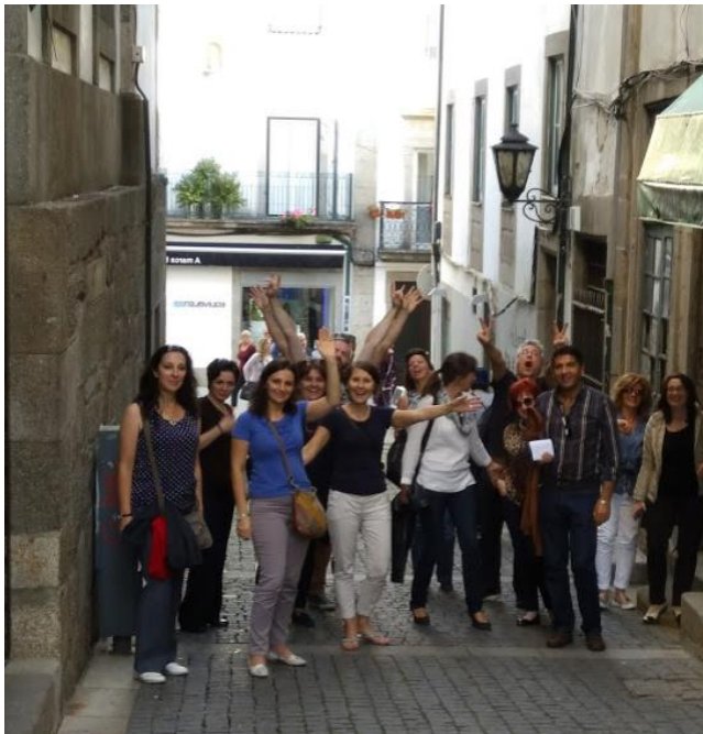
Vierailu Bragan kaupungissa