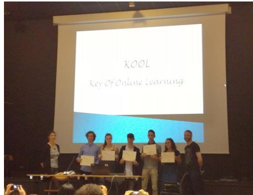
Paras sosiaalisen yrityksen yrityskuvaus