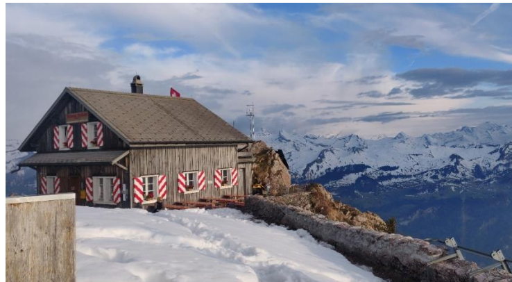
Grosser Mythenin huippu, Sveitsi