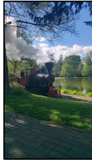
Karlsruhen linnan puistojuna