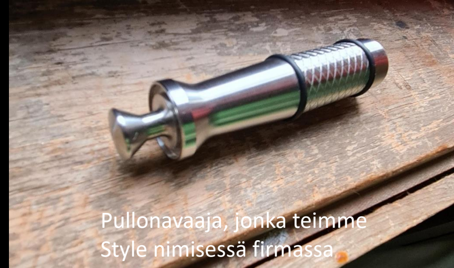
Pullonavaaja, jonka teimme Style nimisessä firmassa

Matkan aikana opin tutustumaan uusiin ihmisiin ja sain vaihtoehdon lähteä ulkomaille työssä oppimaan. Opin reissun aikana puhumaan paremmin englantia sekä kynnykseni puhua englantia ulkomaalaisille laski.