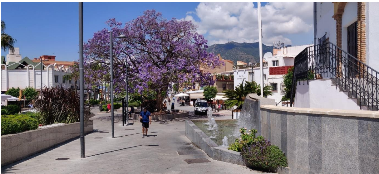
Puut kukkivat kauniisti Arroyo de la Mielin aseman liepeillä.

Matkakohteeni oli Espanjan aurinkorannikolla. Kohde valikoitua opiskelijan työharjoittelun perusteella. Majoitukseni sijaitsi Benalmadenassa. Huoneistossani oli toimiva ilmainen Wifi-yhteys, joka mahdollisti myös etätyöskentelyn. Vierailukohteet sijaitsivat lyhyen paikallisjunamatkan päässä Los Boliches:ssa ja Fuengirolassa.