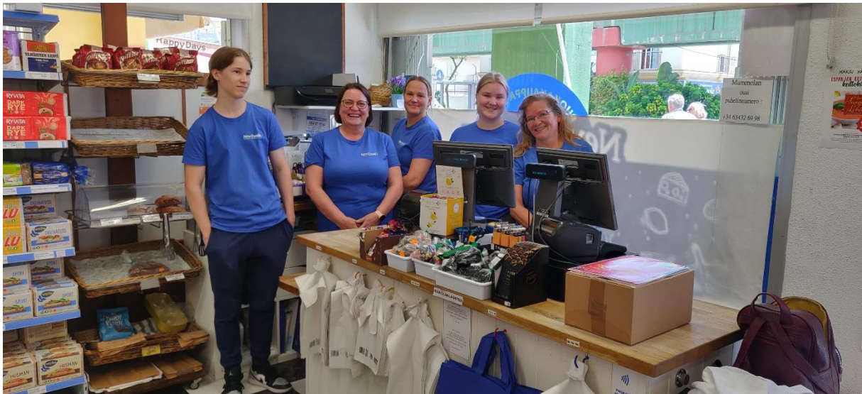
Myymälän henkilökunta ja harjoittelijat.